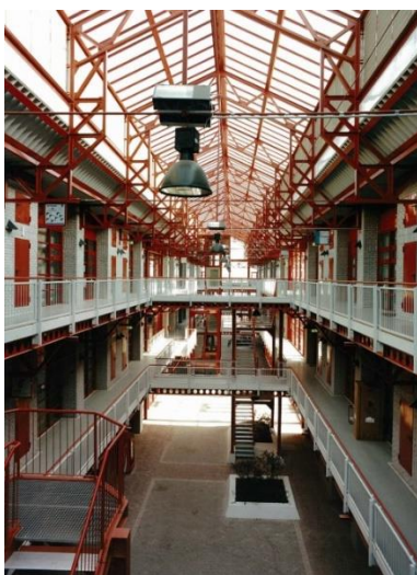
Blick in den Lichthof eines unserer Häuser

Ob Büro, Werkstatt, Fertigungsfläche, Versuchsfeld oder Schulungsraum – das IGZ Magdeburg bietet innovativen Unternehmen aus nahezu allen Branchen gute Entfaltungsmöglichkeiten.