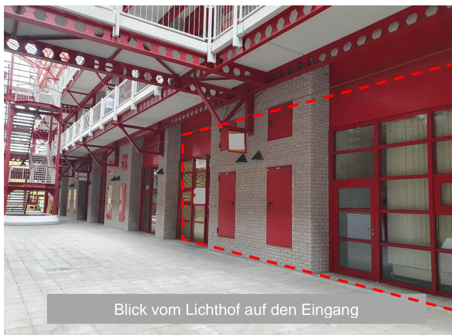
Blick vom Lichthof auf den Eingang